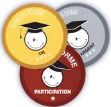
Écussons autocollant primaire