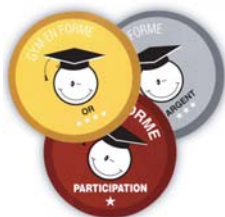
Écussons autocollant secondaire