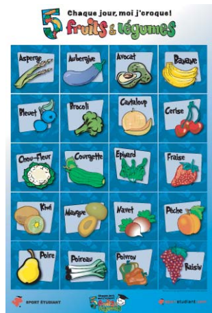
Grande affiche fruits et légumes 24x36