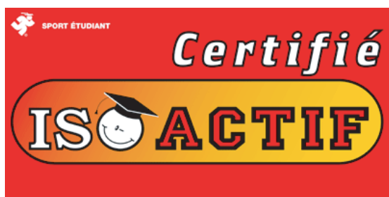
ABS rigide (2'x4') ou Vinyle flexible (3'x6')