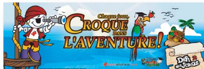
Affiche Défi moi j'croque 13" x 36"