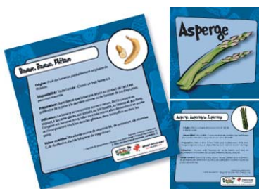
12 fiches de fruits et légumes couleur 5" x 5"