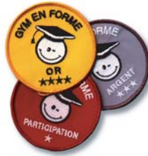
Écussons tissus brodé primaire