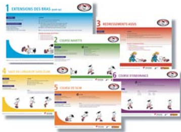
6 affichettes primaire 12" x 10"