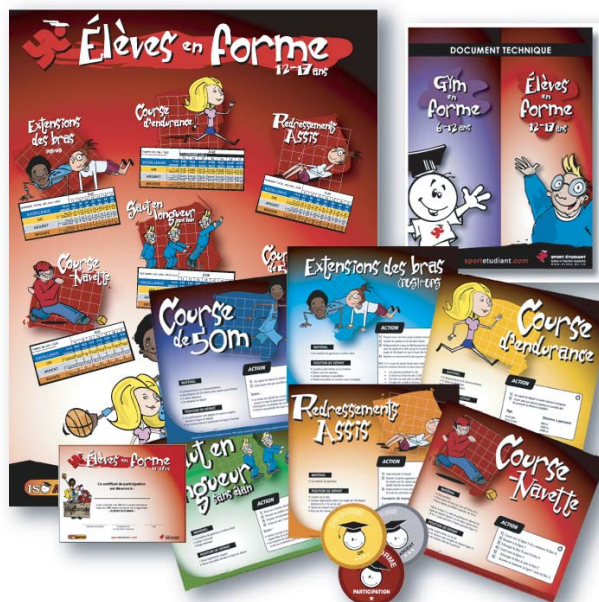
Trousse complète secondaire