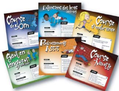
6 affichettes secondaire 12" x 10"