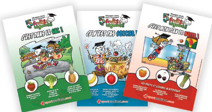
Affiche ensemble de 3 19" x 25"