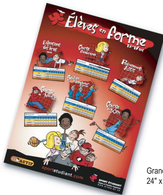
Grande affiche secondaire 24" x 32"