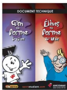
Guide de l'intervenant secondaire & primaire