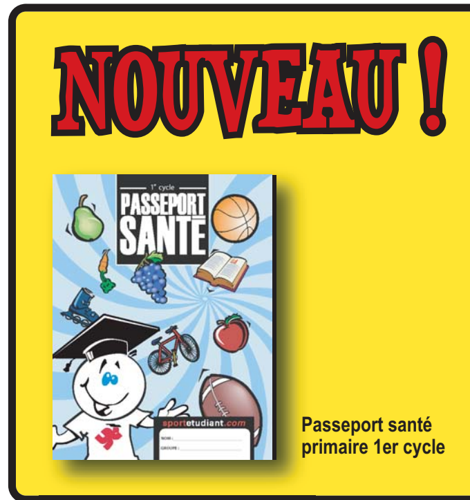
Passeport santé primaire 1er cycle