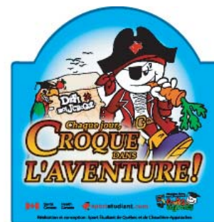
Magnétique Défi moi j'croque