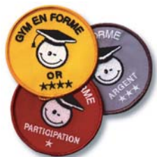
Écussons tissus brodé secondaire