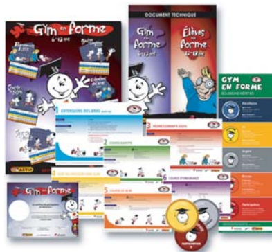
Trousse complète primaire