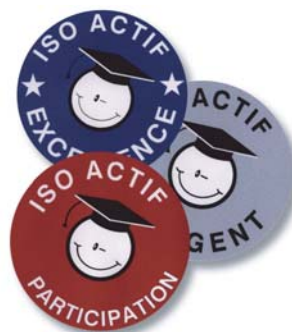
Écussons autocollant isoactif