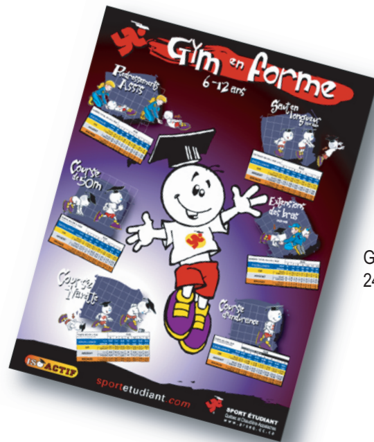
Grande affiche primaire 24" x 32"