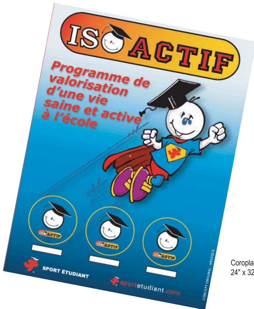
Coroplaste Affiche 24" x 32"