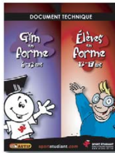
Guide de l'intervenant primaire & secondaire